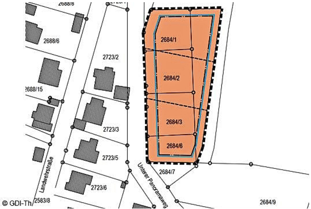
Geltungsbereich Bebauungsplan Nr. 44 „Unterer Panoramaweg“ Fassung 30.05.2022